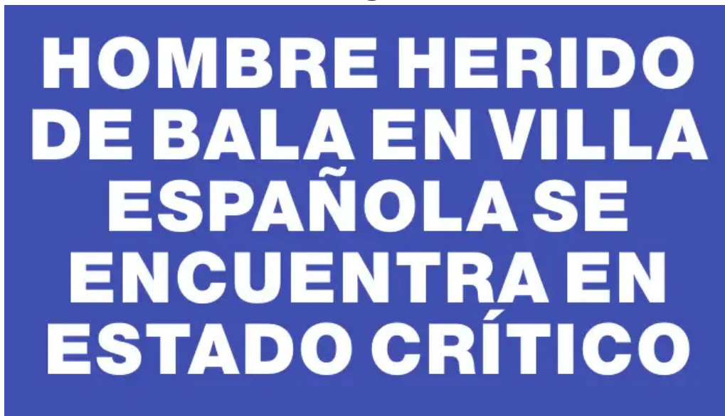
Hombre herido de bala en villa espanola se encuentra en estado critico