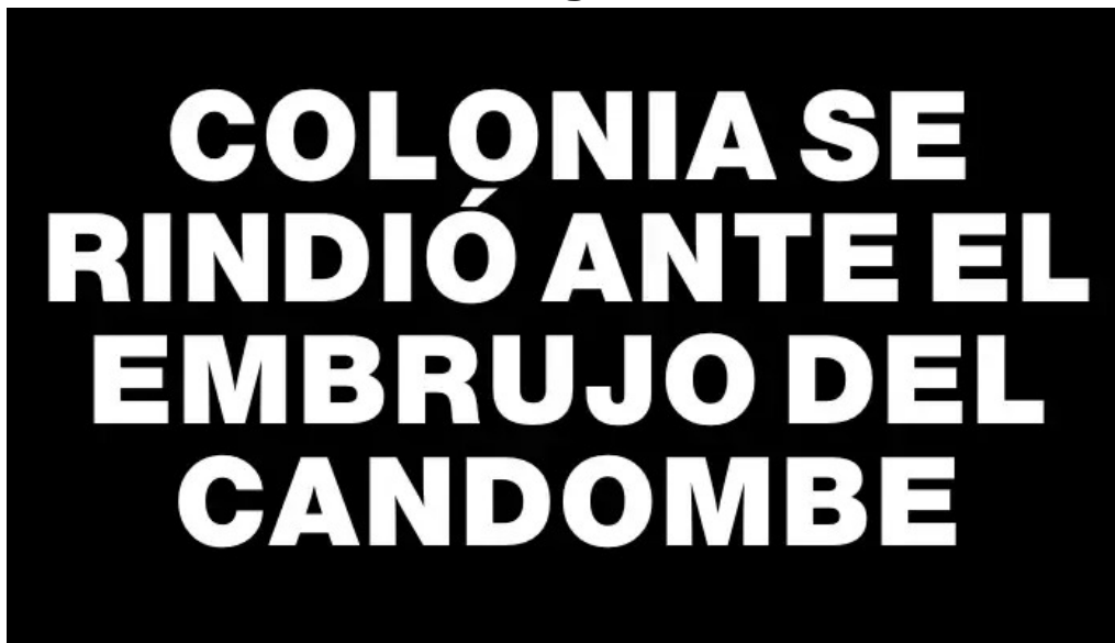
Colonia se rindio ante el embrujo del candombe