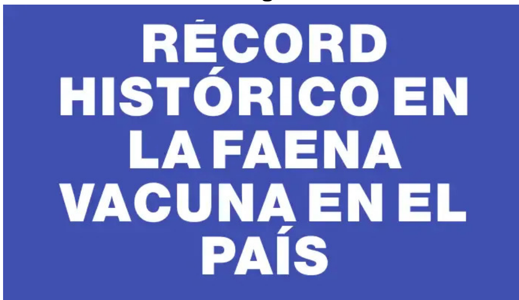
Record historico en la faena vacuna en el pais