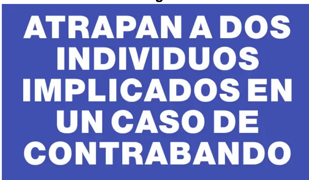
Atrapan a dos individuos implicados en un caso de contrabando