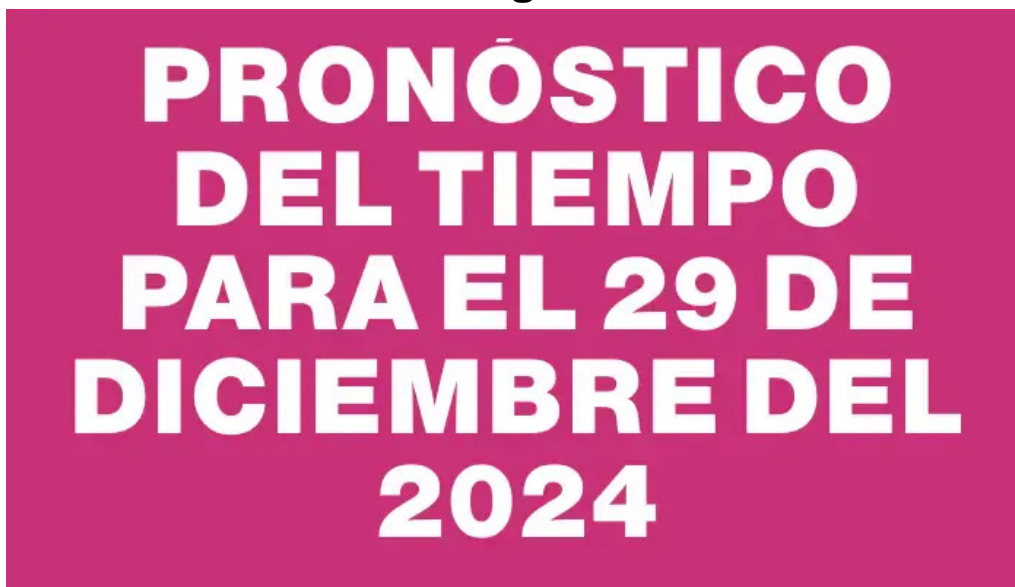
Pronostico del tiempo para el 29 de diciembre del 2024